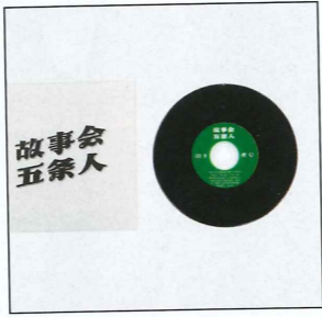
专辑《故事会》，2019年2月出版。（设计/胡子）